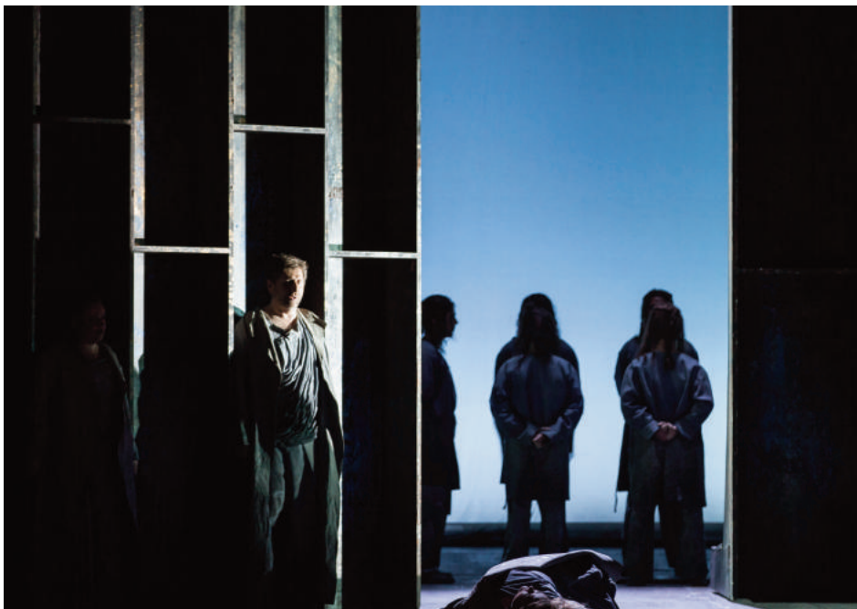
Tristan und Isolde