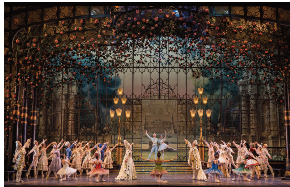
La bella addormentata

Il balletto è andato in scena con la partecipazione del Corpo di Ballo, Primi Ballerini e Solisti del Teatro dell'Opera di Roma con la prima rappresentazione domenica 12 marzo 2017 e repliche 14, 15 e 16 marzo 2017 con spettacoli riservati alle scuole.